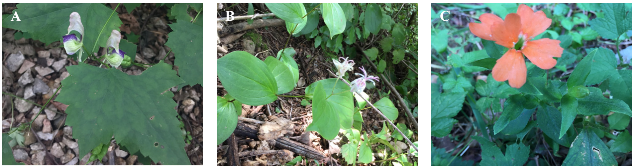
Fig. 2. Three remarkable plants in Mt. Choejeong. A. Aconitum austrokoreense Koidz. B. Tricyrtis macropoda Miq. C. Lychnis cognata Maxim.