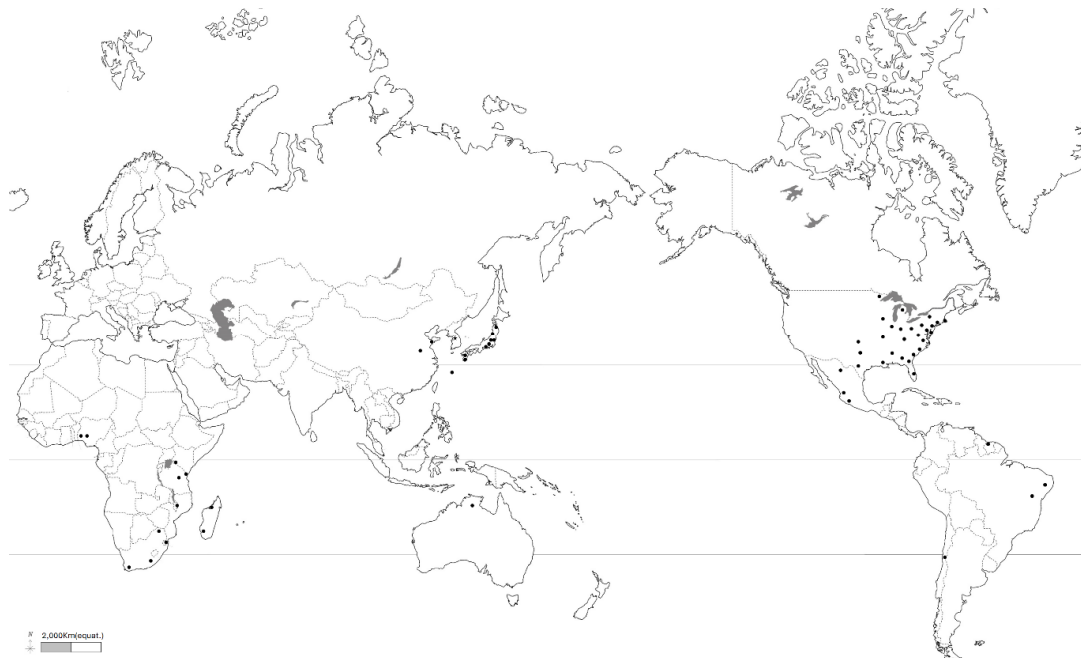
Fig. 1. Distribution maps of Archidium ohioense Schimp. ex Müll. Hal. ● Documental information: Australia, Brazil, Chile, China, Japan, Kenya, Madagascar, Malawa, Mexico, Nigeria, South Africa, Suriname, Tanzania, USA ★ Confirmed domain: Korea (Gyeonggi-do).

Archidium ohioense Schimp. ex Müll. Hal., Syn. Musc. Frond. 2: 517; A. japonicum Broth. ex Ikeno, Shokubutsu